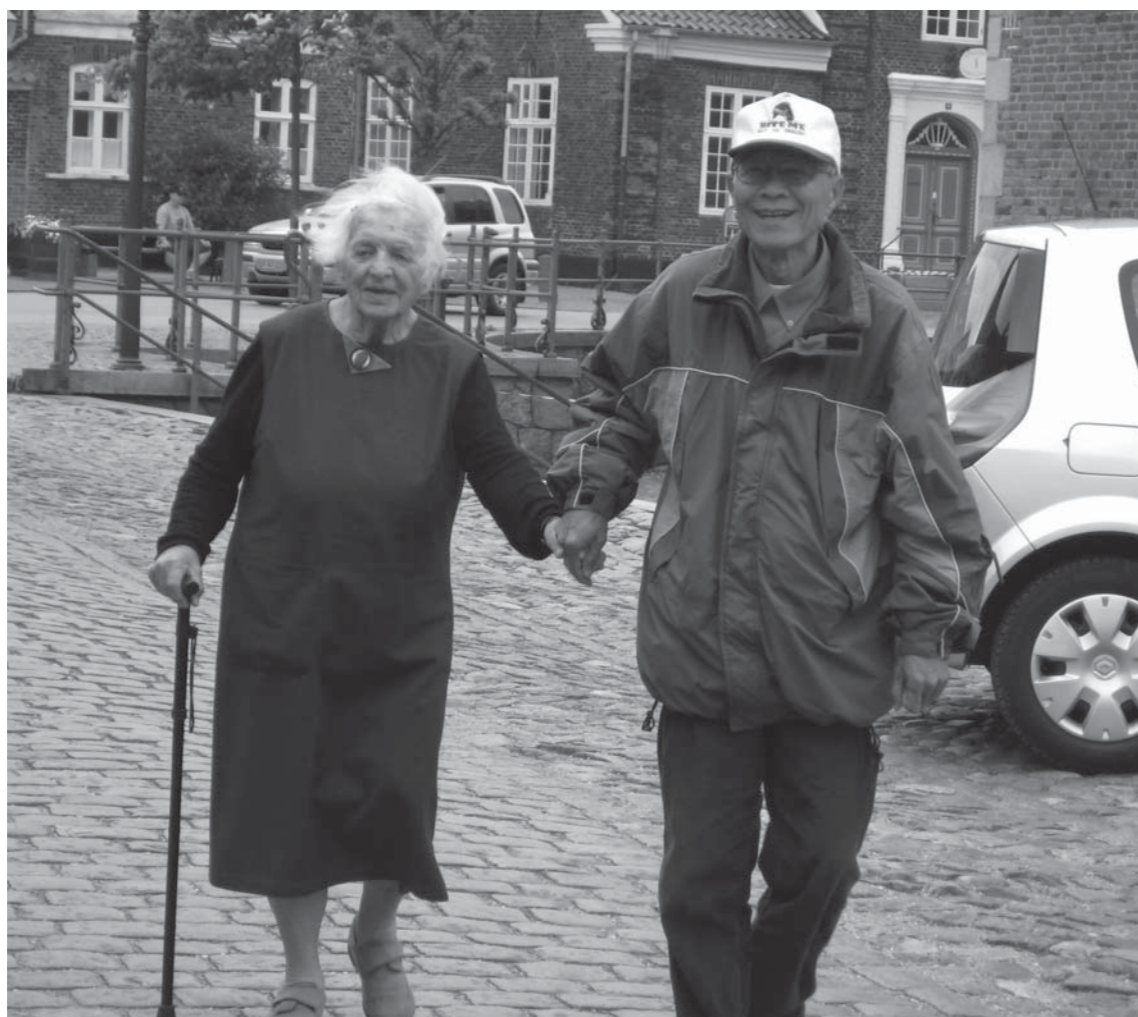
En hjælpende hånd. Udflugt til Ribe.

Deltagernes individuelle motivation for at lære nye mennesker at kende på tværs af sproglige forskelle spiller også en rolle. En kvinde af tyrkisk oprindelse erklærer fx flere gange, at hun "elsker mennesker". Hun undskylder ofte sit dansk, som hun selv betegner som på 1. klasses niveau, men henvender sig alligevel ofte og starter en snak med deltagere, der taler dansk som modersmål. En anden deltager med etnisk majoritetsbaggrund fortæller på den anden side, at han ikke har lært nogen deltagere med etnisk minoritetsbaggrund at kende, fordi han ikke forstår "hvad en afghaner eller en kineser siger."