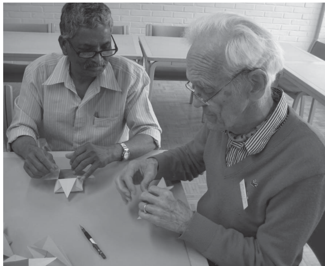
Der foldes japanske papirfigurer på højskolen.

små forårsruller fra Vietnam. Forskellene får heller ikke her lov til at true fællesskabet, selvom der i enkelte situationer må forhandles om grænserne for, hvad det er okay at tale om. Under et oplæg af en præst, der har været udstationeret hos de danske styrker i Afghanistan, spørger en kvinde fx, om han ikke kan komme med en udlægning af debatten i danske medier om, hvorvidt det bør være tilladt at bære tørklæde i offentlige erhverv. Straks kommenteres fra to andre deltagere, at: "Nej, det kan vi ikke få!" Præsten glider af på spørgsmålet. Deltagernes og præstens reaktion kan tolkes som en fællesskabsbevarende reaktion i en potentielt konfliktskabende situation. Den etablerede "working consensus" bibeholdes.