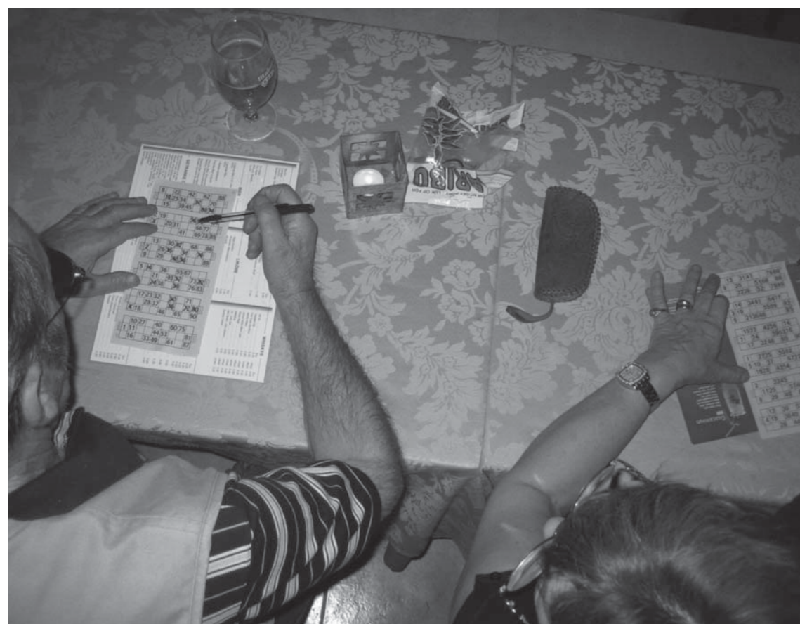
Der spilles banko.

Ferierne står med de planlagte aktiviteter i kontrast til hverdagens struktur, der er sat ud af kraft for en tid (jf. Turner 1982). På ferierne behøver deltagerne ikke, som i hverdagen, at tilrettelægge og tage stilling til dagens forløb. Programmet ligger fast fra begyndelsen, og de kan træde ind i en på forhånd defineret struktur, der giver mulighed for at lade sig føre med og slappe af. Selvom man som pensionist principielt har fri hele tiden, kan man slappe af på en anden måde, når man er på ferie. Aktiviteterne er typisk forbundet med fritid og leg som fx banko, udfugter til seværdigheder og musikalske indslag. Her følger eksempler på, hvordan sådanne aktiviteter foregår.