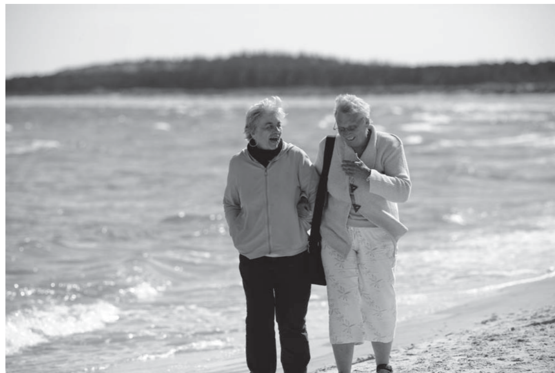
'Makkere' for en ferie.

Det er tydeligt, at nogle deltagere tilbringer meget tid sammen to og to. De kommer til måltiderne sammen, spiser ved siden af eller i nærheden af hinanden, og på ture sidder de sammen i bussen og går rundt sammen ved udflugtsstedet. De er 'makkere' for en ferie.